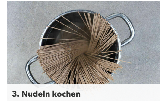
3. Nudeln kochen

Die Karotten , das Zitronengras und den Gemüsemix in derselben Pfanne mit 2EL Pflanzenöl in 2-3Min. bissfest anbraten. Den Knoblauch dazugeben und mit der Sojasauce und der Teriyakisauce ablöschen.