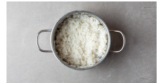
6. Reis kochen

Die Walnüsse und die Brühe in den Topf geben und aufkochen, dann die Hitze reduzieren. Das Fleisch samt Bratensaft zugeben und bei niedriger Hitze ca. 1Std. köcheln lassen, dabei gelegentlich umrühren. Die Auberginen einige Male mit einem scharfen Messer anritzen und auf einem mit Backpapier ausgelegten Backblech im Ofen 35-40Min. weich backen.