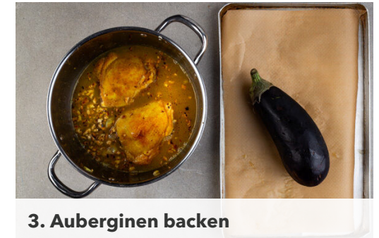
3. Auberginen backen

Die Auberginen abkühlen lassen, dann längs halbieren. Das Fruchtfleisch mit einem Löffel auskratzen und in grobe Stücke schneiden, mit der Granatapfelmelasse in den Topf einrühren und die letzten 15-20Min. der Garzeit mitköcheln. Die Sauce mit Salz abschmecken. Inzwischen in einem mittelgroßen Topf 600ml leicht gesalzenes Wasser zum Kochen bringen.