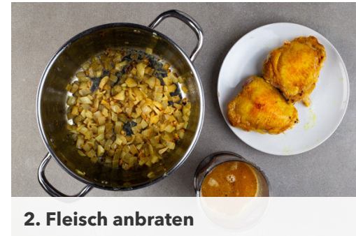
2. Fleisch anbraten

Die Granatäpfel halbieren und über einer mit Wasser gefüllten Schüssel aufbrechen. Die Granatapfelkerne unter Wasser aus den Fruchtwänden und Häutchen lösen. Die schwimmenden Häutchen mit einem Löffel abschöpfen, dann die gepulsten Granatapfelkerne in ein Sieb abgießen.