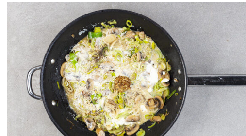
5. Geschnetzeltes zubereiten

Das Fleisch in einer großen Pfanne mit 1EL Olivenöl bei starker Hitze 3-4Min. goldbraun anbraten. Aus der Pfanne nehmen und beiseitestellen.