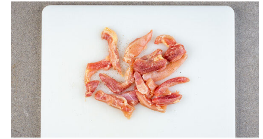
3. Fleisch vorbereiten

Die Pasta in das kochende Wasser geben und in 8-10Min. bissfest kochen. Mit einem Messbecher ca. 150ml Pastawasser abschöpfen, dann die Pasta in ein Sieb abgießen und abtropfen lassen. Anschließend wieder in den Topf geben und abgedeckt warm halten.