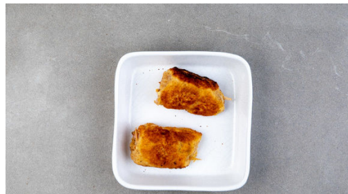
4. Hähnchenrollen garen

Den Backofen auf 200°C (180°C Umluft) vorheizen. Die Kartoffeln samt Schale in ca. 2cm breite Spalten schneiden. Mit 1EL Pflanzenöl und 1 Prise Salz vermengen, auf einem mit Backpapier ausgelegten Backblech verteilen und im Ofen 15-20Min. backen, bis die Kartoffeln knusprig und gar sind.