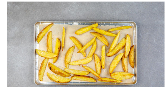
6. Kartoffeln würzen

Auf einem tiefen Teller 1½EL Mehl mit je 1 Prise Salz und Pfeffer würzen. Auf einem zweiten Teller 1 Ei verquirlen. Die Semmelbrösel auf einem dritten Teller bereitstellen. Die Fleischrollen nacheinander im Mehl wenden, durch das verquirlte Ei ziehen und in den Semmelbröseln wenden. Diese leicht andrücken, sodass die Hähnchenrollen gut bedeckt sind.