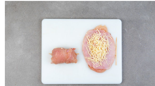
2. Fleisch vorbereiten

Die Hähnchenrollen in einer mittelgroßen Pfanne mit 1EL Pflanzenöl bei mittlerer bis starker Hitze von allen Seiten goldbraun und knusprig anbraten. Die Zahnstocher vorsichtig entfernen, die Hähnchenrollen in eine Auflaufform geben und 10-15Min. im Ofen garen, bis das Fleisch in der Mitte durch ist.