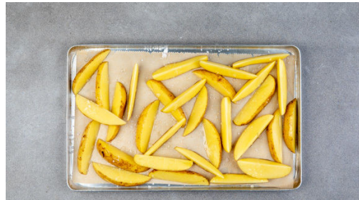
1. Kartoffeln backen

Energie 934kcal, Fett 44.9g, Kohlenhydrate 71.5g, Eiweiß 59.9g