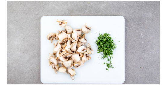
3. Pilze schneiden

Die Pattys in einer großen Pfanne mit 1EL Olivenöl bei mittlerer Hitze auf jeder Seite 2-3Min. anbraten, anschließend auf einem Teller beiseitestellen und abgedeckt ruhen lassen. Die Burgerbrötchen 3-4Min. im Ofen aufbacken.