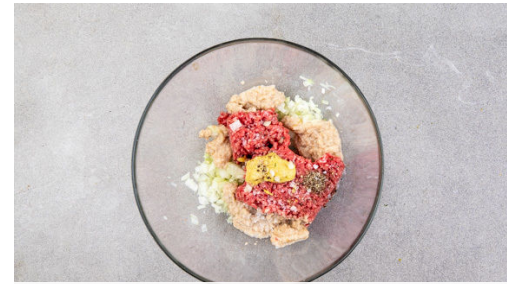
2. Hackfleisch würzen

Die Gurke längs halbieren und in feine Scheibchen schneiden. Mit 2EL Olivenöl, 1EL Essig sowie je 1 kräftigen Prise Salz, Pfeffer und Zucker würzen und den Gurkensalat 5Min. ziehen lassen.