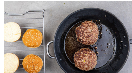
5. Pattys braten

Das Hackfleisch mit der 1/2 der Zwiebeln , den eingeweichten Semmelbröseln und 2EL Senf verkneten. Mit je 2 kräftigen Prise Salz und Pfeffer würzen und zu 4 gleich großen Pattys formen.