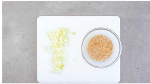
1. Zwiebeln schneiden

Energie 884kcal, Fett 56.1g, Kohlenhydrate 55.9g, Eiweiß 40.4g