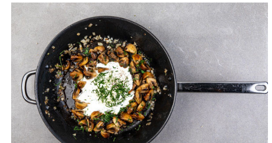
6. Sauce abschmecken

Die Pilze ggf. säubern und je nach Größe vierteln oder sechsteln. Die Petersilie samt Stängeln fein hacken.