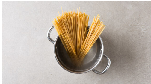
4. Pasta kochen

Den Backofen mit Grillfunktion oder Ober-/Unterhitze auf 220°C vorheizen. In einem mittelgroßen Topf ausreichend gesalzenes Wasser für die Pasta zum Kochen bringen. Die Tomate in kleine Würfel schneiden. Die Zwiebel und den Knoblauch schälen und fein würfeln.