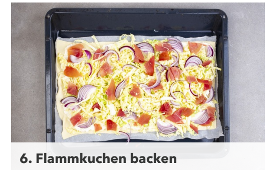
6. Flammkuchen backen

Die Teige mit dem Papier nach unten auf den vorgewärmten Backblechen ausrollen, mit der restlichen Käsecreme bestreichen und den Wirsing und die Zwiebeln darauf verteilen. Vorsicht , die Bleche sind heiß!