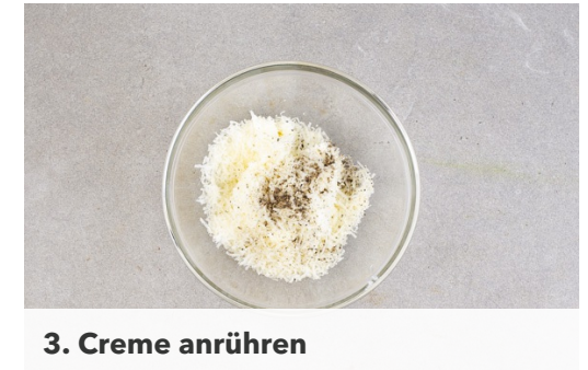
3. Creme anrühren

Die Crème fraîche mit dem geriebenen Käse verrühren und mit Pfeffer würzen.