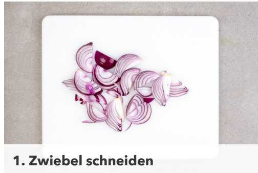
1. Zwiebel schneiden

Energie 629kcal, Fett 29.4g, Kohlenhydrate 64.9g, Eiweiß 22.1g