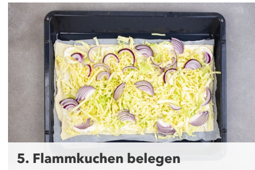
5. Flammkuchen belegen

Vom Wirsing die äußeren Blätter und den Strunk entfernen, dann den Wirsing in möglichst feine Streifen schneiden. 1-2EL Käsecreme zum Wirsing geben und gründlich mit dem Wirsing verkneten. Tipp: Ggf. noch etwas Olivenöl hinzugeben.