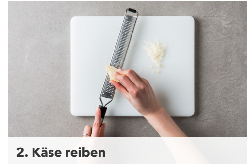
2. Käse reiben

Den Backofen auf 220°C (200°C Umluft) vorheizen. Zwei Backbleche zum Aufwärmen mit in den Ofen geben. Die Zwiebel schälen, halbieren und in feine Streifen schneiden.