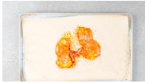
1. Fleisch würzen

Energie 767kcal, Fett 44.8g, Kohlenhydrate 59.1g, Eiweiß 28.4g