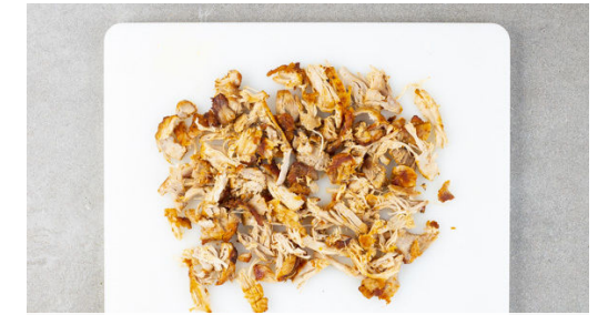
3. Fleisch backen

Die Paprika vierteln, entkernen und in 2-3cm große Stücke schneiden. Die Karotten ggf. schälen und ebenfalls in 2-3cm große Stücke schneiden. Die Zwiebel schälen, halbieren und in grobe Würfel schneiden. Den Knoblauch schälen und fein würfeln. Die Orangenschale abreiben, dann die Orange halbieren und auspressen.