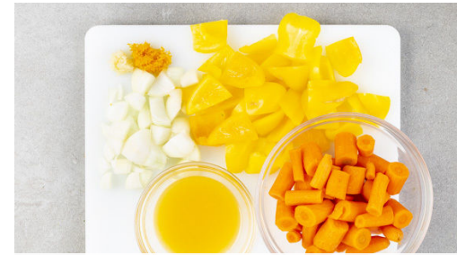
2. Zutaten vorbereiten

Den Backofen auf 220°C (200°C Umluft) vorheizen. Das Fleisch trocken tupfen, nach Belieben mit 1-2 Prisen Paprikapulver sowie Salz und Pfeffer würzen und mit 1EL Olivenöl einreiben. Auf ein mit Backpapier ausgelegtes Backblech geben.