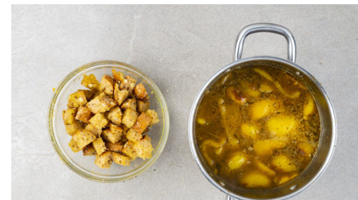
5. Suppe kochen

Die Paprika und die Zwiebeln in einem mittelgroßen Topf mit 1EL Olivenöl und 1 Prise Salz bei mittlerer Hitze 3-5Min. anbraten. Die Karotten , den Knoblauch , 2TL Orangenschale und die Gewürzmischung dazugeben und ca. 1Min. mitbraten.