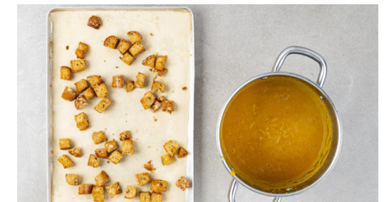
6. Croûtons rösten

Das Brühgewürz in 700ml heißem Wasser auflösen und das Gemüse mit der Brühe ablöschen. Einmal aufkochen lassen und anschließend ca. 15Min. bei mittlerer Hitze köcheln lassen, bis das Gemüse weich ist. Das Brötchen in kleine Würfel schneiden und mit 1EL Olivenöl sowie je 1 Prise Salz und Pfeffer vermengen.