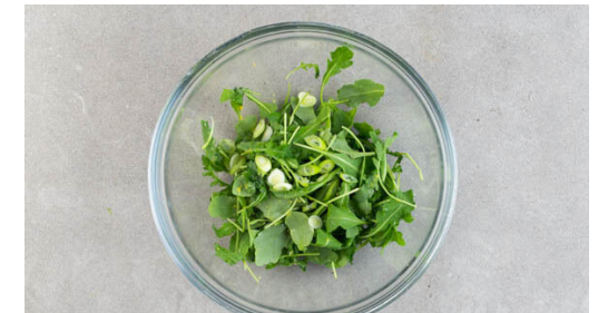
6. Salat anmachen

Den Knoblauch , die Misopaste , 2TL Limettensaft , das Paprikapulver , 2TL Honig und 2EL Wasser zu einer Sauce verrühren.