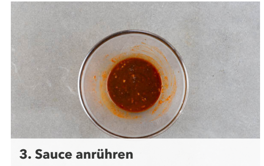
3. Sauce anrühren

Die Süßkartoffelhälften mit je 2-3EL der Pilze belegen und den Käse darüber verteilen. Im Ofen weitere 4-7Min. backen, bis der Käse goldbraun zerlaufen ist.