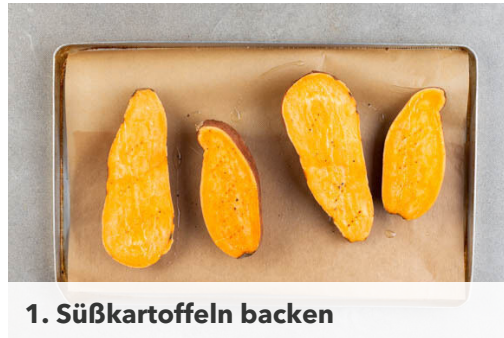
1. Süßkartoffeln backen

Energie 558kcal, Fett 32.0g, Kohlenhydrate 49.9g, Eiweiß 16.2g