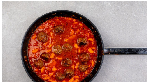
4. Ragout zubereiten

Die Zwiebeln schälen, halbieren und in feine Würfel schneiden. Den Knoblauch schälen und ebenfalls fein würfeln oder durch eine Knoblauchpresse drücken. Das Hackfleisch mit der ½ der Zwiebeln , der ½ des Knoblauchs , je 1TL der Gewürzmischungen und ½TL Salz verkneten und zu 20-24 gleich großen Fleischbällchen formen.