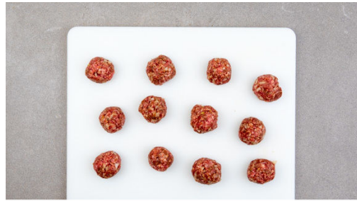
1. Hackbällchen formen

Energie 812kcal, Fett 47.1g, Kohlenhydrate 54.8g, Eiweiß 38.9g