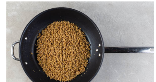
6. Quinoa erwärmen

Die Hackbällchen in einer großen Pfanne mit 2EL Olivenöl bei mittlerer Hitze ca. 2Min. rundum goldbraun anbraten. Auf einem Teller beiseitestellen, die Pfanne aufbewahren.