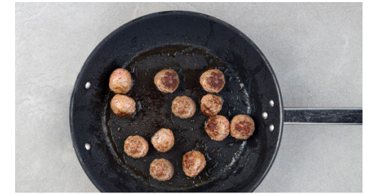
3. Hackbällchen braten

Den Joghurt mit der ½ der Petersilie verrühren und nach Geschmack mit der Zitronenschale sowie Salz und Pfeffer würzen. Die Mandeln in einer zweiten großen Pfanne ohne Zugabe von Fett bei mittlerer Hitze 2-3Min. goldbraun anrösten. Vorsicht , sie können schnell zu dunkel werden. Zum Abkühlen beiseitestellen.