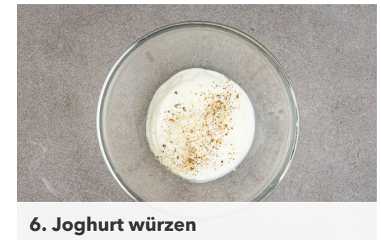
6. Joghurt würzen

Aus 1EL Olivenöl, 1EL Essig und je 1 Prise Salz und Pfeffer ein Dressing anrühren und mit den Gurken , den Tomaten und den Lauchzwiebeln vermengen.