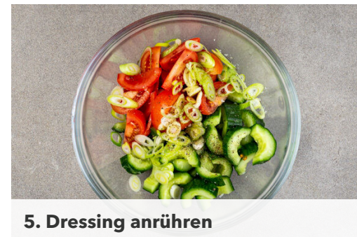
5. Dressing anrühren

Inzwischen die Tomaten achteln. Die Gurke halbieren, ggf. das Kerngehäuse mit einem Löffel herauskratzen und die Gurke in 1-2cm breite Scheiben schneiden. Die Lauchzwiebel schräg in feine Ringe schneiden.