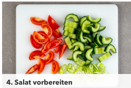
4. Salat vorbereiten

Den Teig mit dem Papier nach unten auf einem Backblech ausrollen und in 4 Rechtecke schneiden. Das Hackfleisch jeweils auf einer Hälfte verteilen und die andere Hälfte darüberklappen. Die Kanten gut zusammendrücken. Die gefüllten Teigtaschen anschließend 10-12Min. im Ofen goldbraun backen.