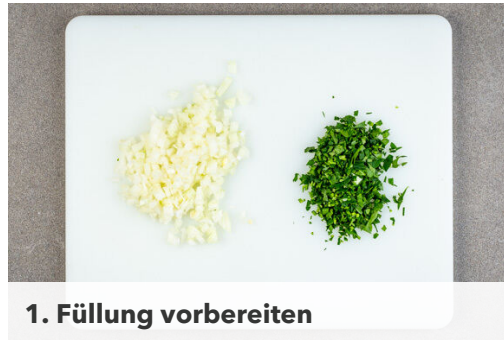
1. Füllung vorbereiten

Energie 1126kcal, Fett 77.1g, Kohlenhydrate 67.3g, Eiweiß 37.4g