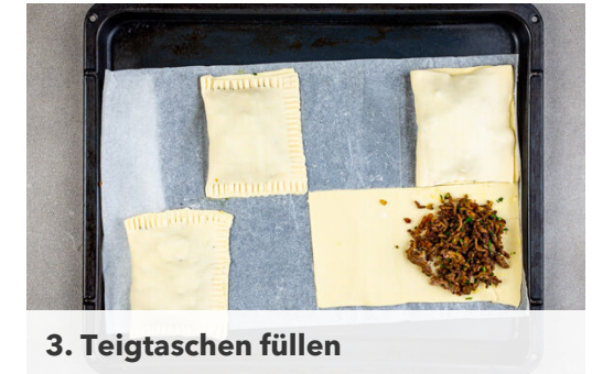
3. Teigtaschen füllen

Das Hackfleisch , die Zwiebeln und die Aprikosen in einer großen Pfanne mit 1EL Olivenöl bei mittlerer bis starker Hitze 4-5Min. anbraten. Die Petersilie unterrühren und mit Salz und Pfeffer sowie der Gewürzmischung abschmecken.