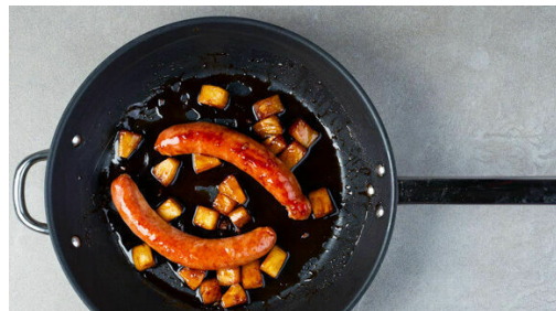
4. Würste braten

Den Backofen auf 200°C (180°C Umluft) vorheizen. In einem mittelgroßen Topf ausreichend gesalzenes Wasser für die Kartoffeln zum Kochen bringen. Die Kartoffeln samt Schale je nach Größe halbieren oder vierteln, in das kochende Wasser geben und 15-20Min. kochen lassen, bis die Kartoffeln gar sind. In ein Sieb abgießen und abkühlen lassen.