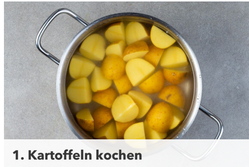
1. Kartoffeln kochen

Energie 1110kcal, Fett 51.5g, Kohlenhydrate 91.3g, Eiweiß 42.8g