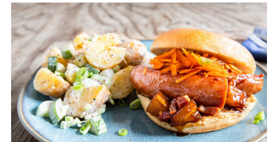
6. Belegen und servieren

Den Speck in einer großen Pfanne ohne Zugabe von Fett bei mittlerer Hitze 3-4Min. rundum knusprig braten. Den Speck beiseitestellen, das ausgetretene Bratfett in der Pfanne lassen.