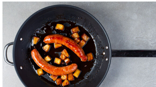
4. Würste braten

Den Backofen auf 200°C (180°C Umluft) vorheizen. In einem mittelgroßen Topf ausreichend gesalzenes Wasser für die Kartoffeln zum Kochen bringen. Die Kartoffeln samt Schale je nach Größe halbieren oder vierteln, in das kochende Wasser geben und 15-20Min. kochen lassen, bis die Kartoffeln gar sind. In ein Sieb abgießen und abkühlen lassen.