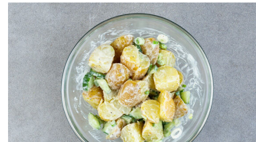
5. Salat mischen

Die Lauchzwiebel in dünne Ringe schneiden. Die Karotte ggf. schälen und mit einer Küchenreibe grob raspeln. Die Gurke längs vierteln und in 1-2cm große Stücke schneiden.