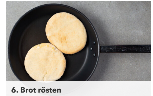
6. Brot rösten

Das Hackfleisch mit der \frac{1}{2} des Knoblauchs , der Petersilie , dem nordafrikanischen Gewürzmischung , dem Paprikapulver nach Belieben und je 1 Prise Salz und Pfeffer gut verkneten, dann zu 4 länglichen Würsten formen und auf 4 Schaschlikspieße ziehen.