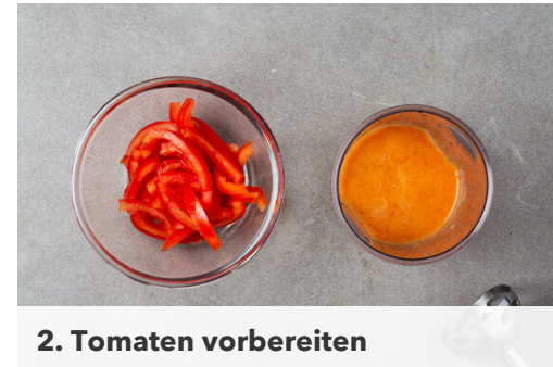
2. Tomaten vorbereiten

Die Paprika und die Zwiebeln in einer großen Pfanne mit 1EL Olivenöl bei starker Hitze 2-3Min. scharf anbraten. Den restlichen Knoblauch , die pürierten Kerngehäuse und die Zwiebelmarmelade unterrühren und ca. 1Min. mitkochen. Die Pfanne vom Herd nehmen, die Tomatenstreifen zugeben und mit Salz, Pfeffer und Zucker abschmecken. Den Dill unterheben.