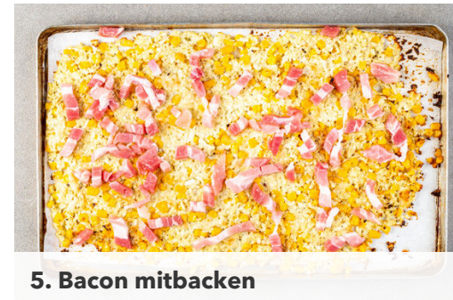
5. Bacon mitbacken

Die Tomaten in kleine Würfel schneiden. Die Lauchzwiebel in feine Ringe schneiden. Die Tomaten und die Lauchzwiebeln mit 1EL Essig, 1 kräftigen Prise Salz und 1 Prise Pfeffer vermengen.