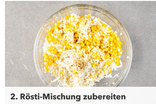
2. Rösti-Mischung zubereiten

Den Backofen auf 220°C (200°C Umluft) vorheizen. Den Knoblauch schälen und fein würfeln. Den Mais in ein Sieb abgießen und abtropfen lassen. Den Käse grob reiben.