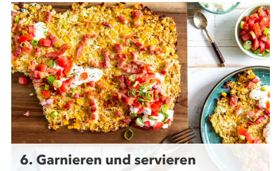
6. Garnieren und servieren

Die Baconstreifen nach ca. 13Min. Backzeit auf der Rösti verteilen, dann 8-10Min. mitbacken, bis der Bacon goldbraun und knusprig ist.