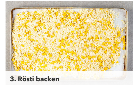
3. Rösti backen

Den Blumenkohlreis mit dem Knoblauch , dem Mais , dem Käse , den Eiern sowie 1TL Senf und je 1 kräftigen Prise Salz und Pfeffer vermengen.