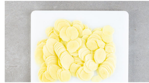
2. Kartoffeln schneiden

Die Zwiebeln und den Knoblauch in einer Auflaufform verteilen, dabei etwas Butter zurückhalten. Die Kartoffelscheiben fächerweise einschichten und mit der restlichen Butter beträufeln. Mit Salz und Pfeffer würzen und die Kartoffeln 25-30Min. im Ofen backen, bis sie gar sind.