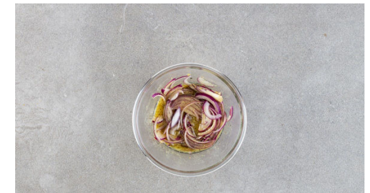
6. Dressing zubereiten

In einer kleinen Pfanne 4EL Butter bei mittlerer Hitze schmelzen und aufschäumen lassen, dann die Zwiebelwürfel und den Knoblauch unterrühren und ca. 1Min. anbraten. Die Pfanne vom Herd nehmen.