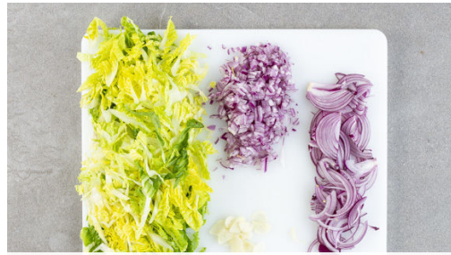
1. Salat schneiden

Energie 660kcal, Fett 35.1g, Kohlenhydrate 47.5g, Eiweiß 35.9g