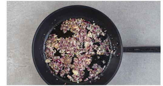
3. Zwiebelbutter vorbereiten

Das Fleisch trocken tupfen und mit Salz und Pfeffer würzen. In einer großen, ofenfesten Pfanne mit 2EL Olivenöl bei starker Hitze auf jeder Seite ca. 1Min. scharf anbraten, dann im Ofen 5-6Min. garen, bis das Fleisch medium durch ist. Tipp: Wer keine ofenfeste Pfanne hat, gibt das Fleisch nach dem Anbraten einfach in eine kleine Auflaufform.