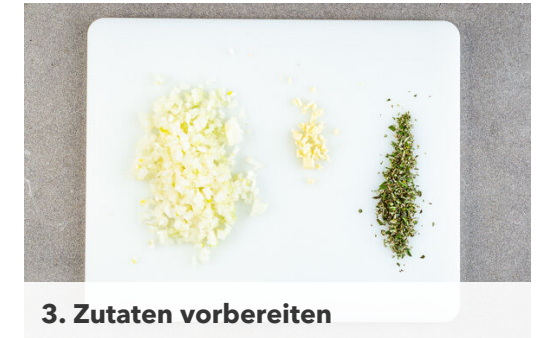
3. Zutaten vorbereiten

Die Zwiebeln in derselben Pfanne bei mittlerer Hitze ca. 2Min. anbraten, bis sie weich sind. Den Knoblauch und den geschnittenen Rosmarin dazugeben und ca. 30Sek. mitbraten. 100ml Wasser angießen, die ½ des Brühwürzes einrühren und die Brühe aufkochen.