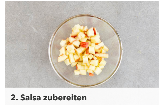
2. Salsa zubereiten

Das Fleisch trocken tupfen und von beiden Seiten mit je 1 Prise Salz und Pfeffer würzen, dann in einer mittelgroßen Pfanne mit 1EL Pflanzenöl bei starker Hitze auf jeder Seite 2-3Min. braten, bis das Fleisch fast durchgegart ist. Aus der Pfanne nehmen und auf einem Teller beiseitestellen.