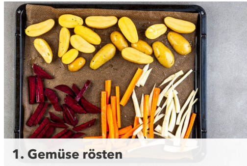
1. Gemüse rösten

Energie 652kcal, Fett 23.4g, Kohlenhydrate 71.7g, Eiweiß 34.1g