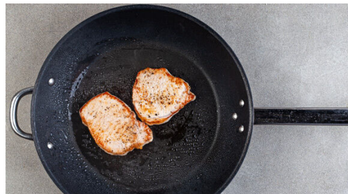
4. Fleisch braten

Den Backofen auf 240°C (220°C Umluft) vorheizen. Die Kartoffeln samt Schale längs halbieren. Die Pastinake , die Karotte und die Rote Bete ggf. schälen und in ca. 1cm breite Stifte schneiden. Das Gemüse auf einem mit Backpapier ausgelegten Backblech mit 1EL Pflanzenöl, 1 kräftigen Prise Salz und 1 Prise Pfeffer vermengen und verteilen. In 20-24Min. im Ofen goldbraun rösten.