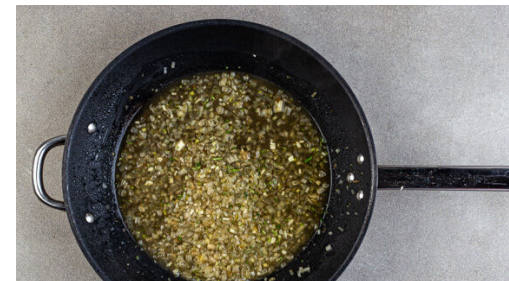
5. Sauce zubereiten

Den Apfel vierteln, entkernen und in ca. 1cm große Würfel schneiden, dann mit 2TL hellem Essig, 1TL Honig sowie je 1 Prise Salz und Pfeffer vermengen.