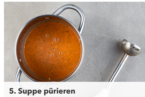
5. Suppe pürieren

Die Tomaten , ca. ⅔ der Basilikumblätter , die passierten Tomaten und 500ml heißes Wasser in einem mittelgroßen Topf mit 1 Prise Muskat zum Kochen bringen. Das Brühgewürz unterrühren, mit Salz, Pfeffer und 1 Prise Zucker abschmecken und die Suppe bei mittlerer Hitze 10-15Min. sanft köcheln lassen.