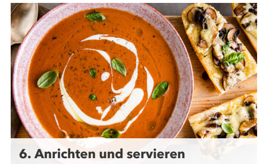
6. Anrichten und servieren

Die Pilze ggf. säubern und in dünne Scheiben schneiden. In einer mittelgroßen Pfanne mit 1EL Olivenöl bei starker Hitze 4-5Min. anbraten. Die Hitze reduzieren, den Knoblauch unterrühren und 1-2Min. mitgaren, dann mit Salz und Pfeffer würzen.