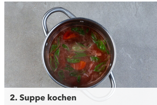
2. Suppe kochen

Die Baguettebrötchen aufschneiden und auf ein mit Backpapier ausgelegtes Backblech legen. Mit der ½ des Käses bestreuen und die Pilze auf dem Käse verteilen. Mit dem restlichen Käse bestreuen und die Baguettes ca. 5Min. im Ofen überbacken, bis der Käse zerlaufen ist.