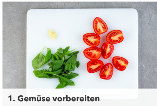
1. Gemüse vorbereiten

Energie 766kcal, Fett 38.5g, Kohlenhydrate 79.3g, Eiweiß 26.6g