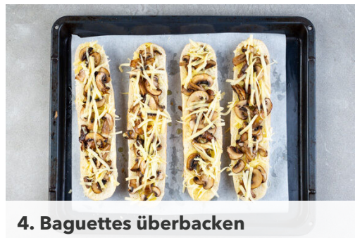
4. Baguettes überbacken

Den Backofen mit Grillfunktion oder Ober-/Unterhitze auf 220°C vorheizen. Die Tomaten vierteln. Die Basilikumblätter abzupfen. Tipp: Wer mag, kann die Stängel klein schneiden und in der Suppe mitkochen. Den Knoblauch schälen und fein würfeln.