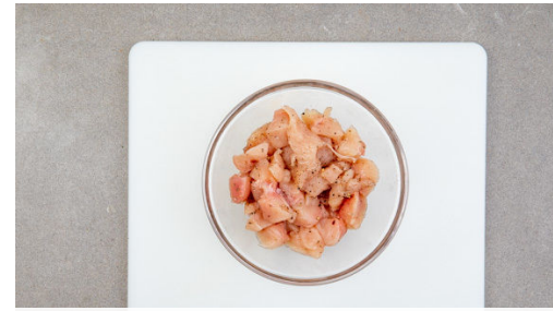
2. Fleisch vorbereiten

Den Teig mit dem Papier nach unten auf einem Backblech ausrollen, in 4 gleich große Stücke schneiden und nach Belieben mit etwas Pfeffer würzen. Tipp: Wer mag, kann den Teig mit verquirltem Eigelb bestreichen. Im Ofen 8-10Min. backen, bis der Teig schön aufgegangen und goldbraun ist.