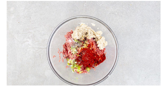
3. Hackfleisch würzen

Die Karotten , den Knoblauch und die restlichen Lauchzwiebeln zu den Hackbällchen in die Pfanne geben, dann die gehackten Tomaten unterrühren und mit Salz und Pfeffer abschmecken. Alles weitere 6-8Min. sanft zu einem dicklichen Tomatensugo einköcheln lassen.