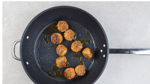
4. Hackbällchen anbraten

In einem großen Topf ausreichend gesalzenes Wasser für die Kartoffeln zum Kochen bringen. Die Kartoffeln schälen und in 2-3cm große Stücke schneiden. In das kochende Wasser geben und in 15-20Min. gar kochen. In ein Sieb abgießen und abtropfen lassen, dann zurück in den Topf geben und warm halten.