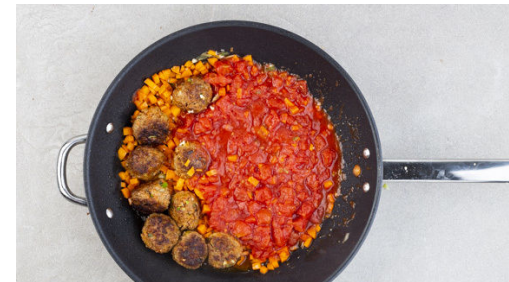
5. Sugo zubereiten

Die Karotten ggf. schälen und in ca. 0,5cm kleine Würfel schneiden. Den Knoblauch schälen und fein würfeln. Die Semmelbrösel in 80-100ml Wasser einweichen.