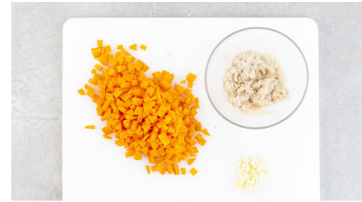
2. Karotte schneiden

Aus der Hackfleischmasse mit den Händen ca. 2cm große Hackbällchen formen und diese in einer großen Pfanne mit 2EL Olivenöl bei mittlerer Hitze 2-3Min. rundum anbraten.