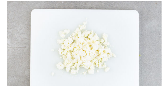
6. Feta zerkrümeln

Die Lauchzwiebeln fein hacken. Das Hackfleisch mit der 1/2 der Lauchzwiebeln , den eingeweichten Semmelbröseln und 1/2-1TL geräuchertem Paprikapulver gut verkneten und die Hackfleischmasse mit je 1 kräftigen Prise Salz und Pfeffer würzen.