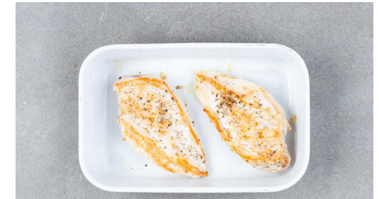
3. Fleisch garen

Die Karotte ggf. schälen, der Länge nach vierteln und in kleine Würfel schneiden. Den Stangensellerie ebenfalls in kleine Würfel schneiden. Den Dill samt Stängeln fein schneiden.