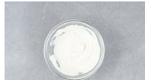
5. Dip anrühren

Die Zwiebeln , die Karotten und den Sellerie in derselben Pfanne mit 1EL Olivenöl bei mittlerer Hitze 2-3Min. farblos anschwitzen. Den Knoblauch und die Aprikosen untermischen. Mit den Linsen samt Flüssigkeit ablöschen, kurz aufkochen lassen und 2-3Min. sanft köcheln. Nach Geschmack mit der Gewürzmischung , Salz, Pfeffer und Essig würzen.