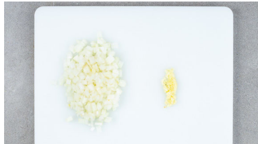
1. Zwiebel schneiden

Energie 734kcal, Fett 38.3g, Kohlenhydrate 40.8g, Eiweiß 50.0g