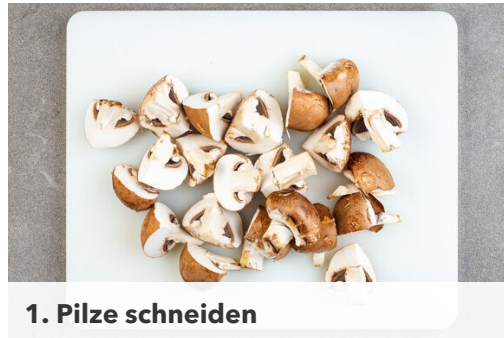
1. Pilze schneiden

Energie 903kcal, Fett 36.4g, Kohlenhydrate 100.2g, Eiweiß 44.1g