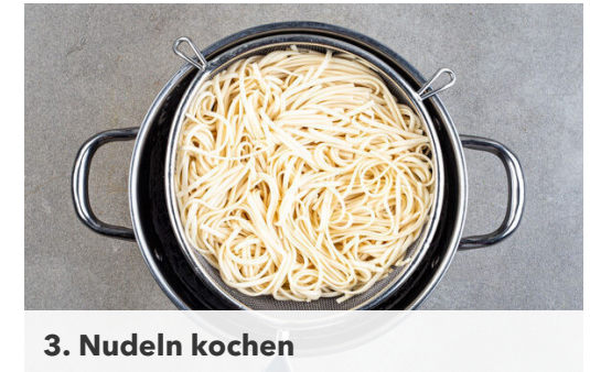
3. Nudeln kochen

Die Pilze in einer großen Pfanne oder einem Wok mit 1EL Pflanzenöl bei mittlerer bis starker Hitze 3-4Min. goldbraun anbraten. Den Knoblauch schälen und fein würfeln. Die Tomaten in ca. 1cm große Würfel schneiden. Die Pilze aus der Pfanne nehmen und beiseitestellen, die Pfanne aufbewahren.