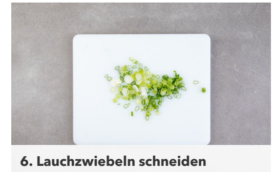
6. Lauchzwiebeln schneiden

Das Hackfleisch mit 1TL Salz und 1 kräftigen Prise Pfeffer würzen. Die Pilze zurück in die Pfanne geben, dann die Nudeln unterheben und nochmals mit Salz und Pfeffer abschmecken.