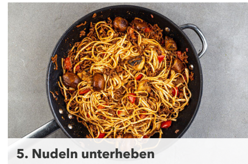
5. Nudeln unterheben

Inzwischen 2EL Pflanzenöl in der Pfanne bei mittlerer Hitze erwärmen. Das Hackfleisch zugeben und in 4-6Min. gar und leicht knusprig braten. Die 1/2-3/4 der Chilipaste , die Misopaste und die Tomatenwürfel einrühren und 30Sek.-1Min. erhitzen, dann den Knoblauch hinzugeben und ebenfalls ca. 30Sek. mitbraten.