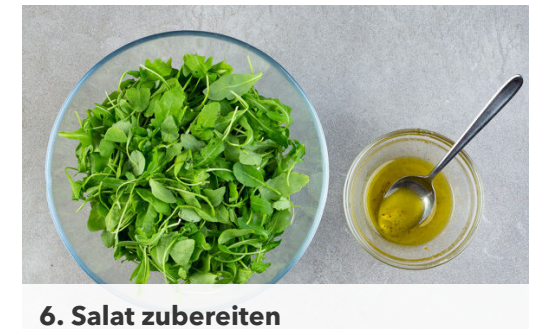
6. Salat zubereiten

Das Fleisch trocken tupfen und zwischen zwei Lagen Frischhaltefolie oder Backpapier mit einer schweren Pfanne ca. 0,5cm dünn plattieren. Den Hartkäse fein reiben. 4EL Mehl auf einen Teller geben, auf einem weiteren Teller 1 Ei mit 1EL Wasser verquirlen, auf einem dritten Teller das Paniermehl mit der ½ des Hartkäses sowie je 1 Prise Salz und Pfeffer vermengen.