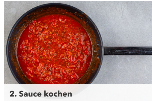
2. Sauce kochen

Das Fleisch der Reihe nach im Mehl, im Ei und in den Käsebröseln wenden und die Panade leicht andrücken. In einer zweiten großen Pfanne 1cm Pflanzenöl bei mittlerer bis starker Hitze erwärmen und die Schnitzel auf jeder Seite 1-2Min. goldbraun ausbacken. Auf etwas Küchenkrepp abtropfen lassen.