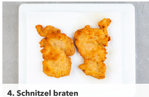
4. Schnitzel braten

Den Backofen auf 200°C (180°C Umluft) vorheizen. Den Knoblauch schälen und fein würfeln. Die Basilikumblätter abzupfen und fein schneiden, die Stängel sehr fein hacken. Die Gnocchi in einer Auflaufform mit 2EL Olivenöl, der ½ des Goudas , der ½ der Basilikumblätter sowie Salz und Pfeffer vermengen und in 20-25Min. im Ofen goldbraun backen.