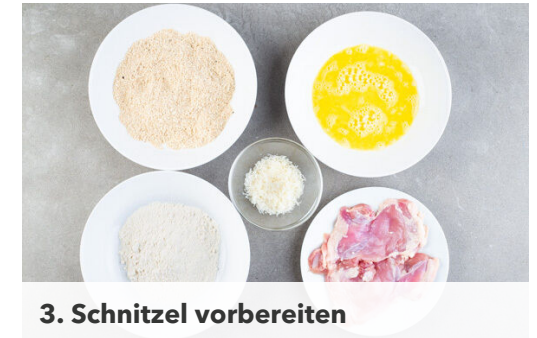
3. Schnitzel vorbereiten

Die Sauce mit Salz, Pfeffer und 1 Prise Zucker abschmecken und das restliche Basilikum unterrühren. Die ½ der Sauce über die Gnocchi geben, dann die Schnitzel auf die Gnocchi legen und mittig mit der übrigen Sauce bedecken. Den restlichen Gouda darauf verteilen und die Schnitzel 6-7Min. überbacken, bis der Käse geschmolzen ist.