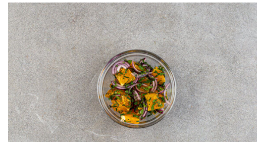
5. Salat zubereiten

Die Pinienkerne in einer großen Pfanne ohne Zugabe von Fett bei mittlerer Hitze 1-2Min. goldbraun anrösten. Vorsicht , sie können schnell zu dunkel werden. Zum Abkühlen herausnehmen, beiseitestellen und die Pfanne aufbewahren.