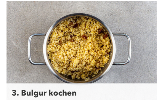
3. Bulgur kochen

Die Orange mit einem Messer schälen, dabei auch die weiße Haut entfernen. Das Fruchtfleisch zwischen den Häutchen in Spalten ausschneiden. Die Orangenstücke mit den Zwiebelstreifen , der Minze und 1EL Olivenöl vermengen. Den Salat mit Salz und Pfeffer abschmecken.