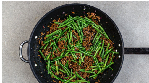
4. Fleisch braten

In einem kleinen Topf 300ml leicht gesalzenes Wasser für den Bulgur zum Kochen bringen. Die Zwiebel schälen, halbieren, dann eine Hälfte fein würfeln und die andere Hälfte in feine Streifen schneiden. Den Knoblauch schälen und fein würfeln. Die Minzeblätter abzupfen und fein schneiden. Die Petersilie und den Koriander samt Stängeln ebenfalls fein schneiden.