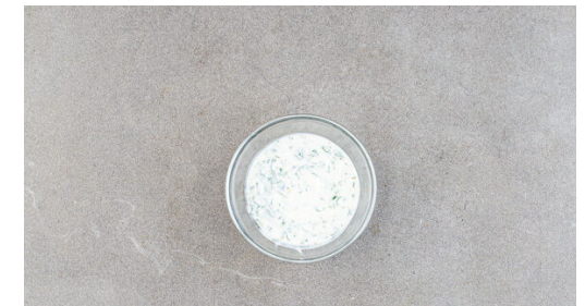
6. Sauce anrühren

Den Bulgur in das kochende Wasser rühren und abgedeckt bei niedriger Hitze 8-10Min. sanft köcheln lassen, bis das Wasser aufgesaugt und der Bulgur gar ist. Die Rosinen unterheben und abgedeckt noch ca. 5Min. ohne Hitzezufuhr ziehen lassen.