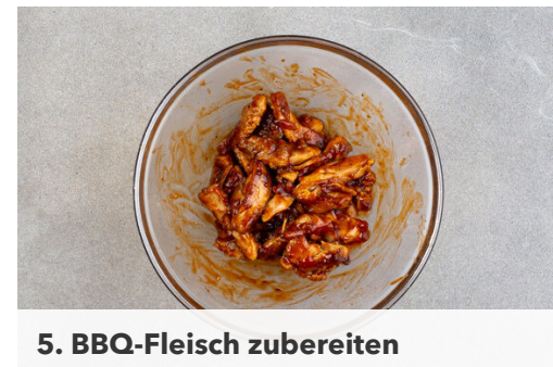
5. BBQ-Fleisch zubereiten

Nebenher die Tortillas nacheinander in einer zweiten Pfanne bei mittlerer Hitze auf jeder Seite ca. 30Sek. erwärmen. Die fertigen Tortillas auf einem Teller mit einem Geschirrtuch abgedeckt warm halten.