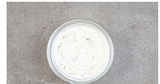
6. Crème fraîche würzen

Das Aprikosenchutney mit der ½ der Lauchzwiebeln , der ½ des Korianders sowie 4EL Ketchup, 2TL Essig und 1TL Senf zu einer Sauce verrühren.