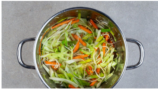
1. Gemüse anbraten

Energie 1054kcal, Fett 49.5g, Kohlenhydrate 113.4g, Eiweiß 40.4g