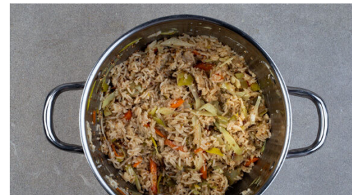
5. Reis verfeinern

Den Reis in einem Sieb kalt abspülen, bis das Wasser klar bleibt, dann in den Topf zu dem Gemüse geben. Die Zwiebelmarmelade einrühren und das kochende Wasser angeben. Den Reis aufkochen und abgedeckt bei niedriger Hitze 13-15Min. kochen, bis das Wasser aufgesogen und der Reis gar ist, dabei gelegentlich umrühren. Noch ca. 5Min. ohne Hitzezufuhr ziehen lassen.