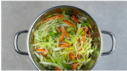
1. Gemüse anbraten

Energie 1043kcal, Fett 48.1g, Kohlenhydrate 114.5g, Eiweiß 39.8g