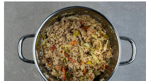
5. Reis verfeinern

Den Reis in einem Sieb kalt abspülen, bis das Wasser klar bleibt, dann in den Topf zu dem Gemüse geben. Die Zwiebelmarmelade einrühren und das kochende Wasser angeießen. Den Reis aufkochen und abgedeckt bei niedriger Hitze 13-15Min. kochen, bis das Wasser aufgesogen und der Reis gar ist, dabei gelegentlich umrühren. Noch ca. 5Min. ohne Hitzezufuhr ziehen lassen.