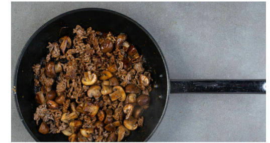
3. Pilze und Hack braten

Den Reis mit dem Sesam und dem Sesamöl vermengen und nach Geschmack mit Salz würzen.