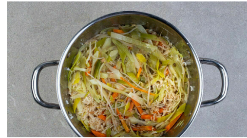
2. Reis und Gemüse kochen

4EL hellen Essig gründlich mit 1EL Zucker und 1 kräftigen Prise Salz verrühren. Die Karotten ggf. schälen und mit einem Sparschäler in breite Streifen schneiden. Den Einlegesud vorsichtig in die Karottenstreifen einmassieren.