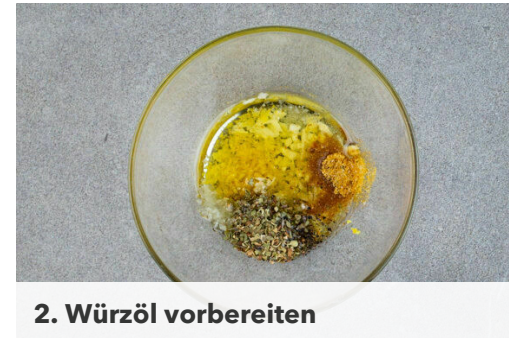
2. Würzöl vorbereiten

In einem mittelgroßen Topf 600ml Wasser zum Kochen bringen. Den Topf vom Herd nehmen, den Couscous mit der übrigen Gewürzmischung in das kochende Wasser rühren und abgedeckt 8-10Min. quellen lassen.