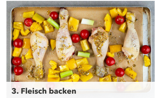
3. Fleisch backen

Nach ca. 20Min. Backzeit den Feta mit den Fingern über dem Backblech zerkrümeln und ca. 5Min. mitbacken. Den grünen Teil der Lauchzwiebeln in feine Ringe schneiden. Die Zitrone halbieren und eine Hälfte auspressen, die andere Hälfte in Spalten schneiden.