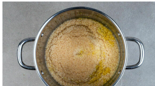
4. Couscous garen

Den Backofen auf 200°C (180°C Umluft) vorheizen. Die Paprika vierteln, entkernen und in ca. 2cm große Stücke schneiden. Den Knoblauch schälen und grob würfeln. Die Zitronenschale abreiben. Den grünen Teil der Lauchzwiebeln beiseitelegen, den weißen Teil in ca. 2cm große Stücke schneiden.