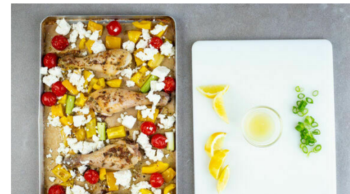
5. Feta mitbacken

Den Knoblauch , die Zitronenschale und den Oregano mit der 1/2 der Gewürzmischung , 3EL Olivenöl und je 1TL Salz und Pfeffer verrühren.