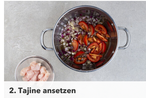
2. Tajine ansetzen

So viel heißes Wasser angießen, dass die Süßkartoffeln bedeckt sind. Die Tajine abgedeckt zum Kochen bringen und anschließend bei mittlerer bis niedriger Hitze ca. 15Min. garen. Dann weitere ca. 10Min. ohne Deckel köcheln lassen, bis die Tajine etwas eingedickt ist.