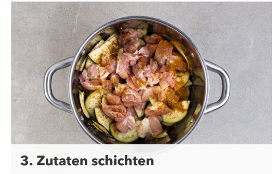
3. Zutaten schichten

Inzwischen die Mandeln ggf. grob hacken und in einer kleinen Pfanne ohne Zugabe von Fett bei mittlerer Hitze 1-2Min. goldbraun anrösten. Vorsicht , sie können schnell zu dunkel werden. Zum Abkühlen aus der Pfanne nehmen und beiseitestellen.