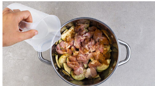
4. Tajine garen

Die Zwiebel schälen, halbieren und fein würfeln. Den Knoblauch schälen und in feine Scheibchen schneiden. Die Süßkartoffel schälen und in mundgerechte Würfel schneiden. Die Tomaten in Spalten schneiden. Die Aubergine längs halbieren und quer in dünne Scheiben schneiden.