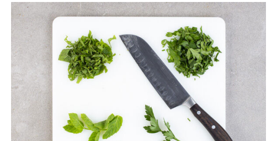
6. Kräuter schneiden

Der Reihe nach die Süßkartoffeln , die Auberginen und das Fleisch in den Topf schichten, dabei jede Schicht mit etwas vom restlichen Brühwürz und Ras el-Hanout würzen.