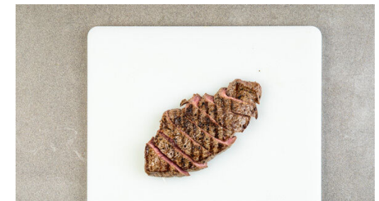
6. Fleisch braten

Die Kartoffeln und den Knoblauch aus dem Ofen nehmen. Den Knoblauch schälen und mit einer Gabel zerdrücken, dann mit 2EL Mayonnaise verrühren. Die Knoblauchsauce mit den Kartoffeln und der Zucchini vermengen. Das Fleisch trocken tupfen, von beiden Seiten mit insgesamt 1EL Olivenöl bepinseln und mit je 1 Prise Salz und Pfeffer würzen.