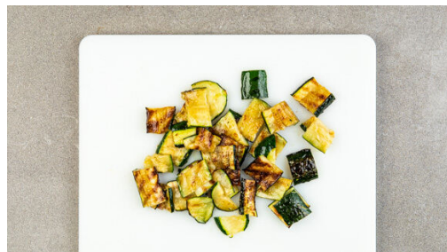
4. Zucchini grillen

Die Kartoffeln mit 2TL Olivenöl, der 1/2 der Gewürzmischung , 1/2TL Salz und 1 Prise Pfeffer vermengen, in den vorgeheizten Ofen schieben und 18-25Min. backen, bis sie goldbraun sind. Nach der Hälfte der Zeit wenden, die ungeschälte Knoblauchzehe mit aufs Blech geben und für die restliche Zeit mitbacken.