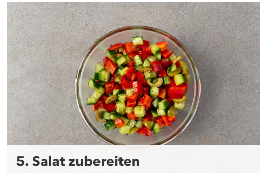
5. Salat zubereiten

Das Hackfleisch in einer mittelgroßen Pfanne mit 1EL Olivenöl bei mittlerer bis starker Hitze 3-4Min. anbraten. Den Knoblauch , die 1/2 des Oreganos und je 1 kräftige Prise Salz und Pfeffer zugeben und ca. 1Min. mitbraten, dann die Pfanne vom Herd nehmen.