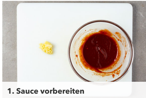
1. Sauce vorbereiten

Energie 1005kcal, Fett 58.5g, Kohlenhydrate 70.6g, Eiweiß 44.4g