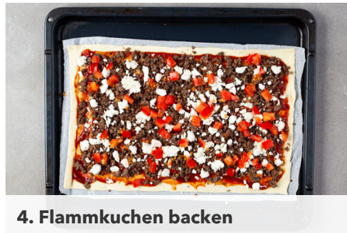
4. Flammkuchen backen

Den Backofen auf 210°C (190°C Umluft) vorheizen. Den Knoblauch schälen und sehr fein würfeln oder durch eine Knoblauchpresse drücken. Das Tomatenmark mit 3EL Wasser und 1EL Balsamicoessig verrühren und mit je 1 kräftigen Prise Salz und Pfeffer würzen.