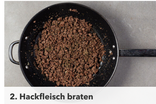
2. Hackfleisch braten

Den Teig mit dem Papier nach unten auf einem Backblech ausrollen, gleichmäßig mit der Sauce bestreichen und das Hackfleisch darauf verteilen. Mit dem Feta und den Tomaten belegen und den restlichen Oregano darüberstreuen. Den Flammkuchen im Ofen auf der unteren Schiene 15-20Min. backen, bis die Ränder goldbraun und leicht knusprig sind.