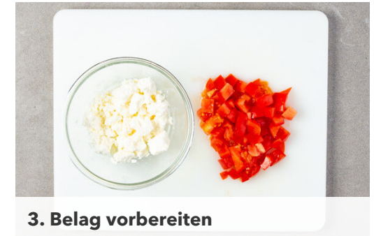
3. Belag vorbereiten

Die Gurke längs vierteln und in kleine Würfel schneiden. Die Paprika vierteln, entkernen und in kleine Würfel schneiden. Die Oliven in Ringe schneiden und mit der Gurke und der Paprika vermengen. 1EL Olivenöl und 1EL Essig unterrühren und den Salat mit je 1 kräftigen Prise Salz und Pfeffer würzen.