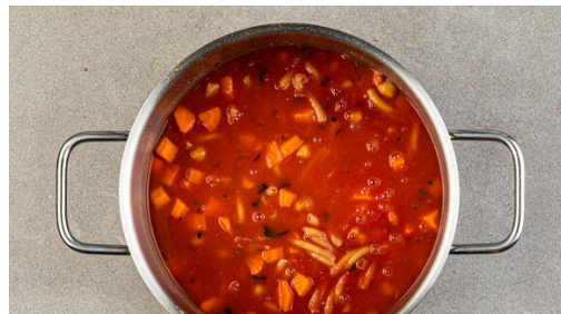
4. Pasta kochen

Die Karotten und die Kichererbsen in dem Topf mit dem Bratenfett und 2EL Olivenöl bei mittlerer Hitze 4-5Min. anbraten. Die Oreganoblättchen von den Stängeln streifen und grob schneiden. Das Brühgewürz mit 1 Prise Pfeffer in den Topf rühren, dann den Oregano und den Knoblauch hinzufügen und ca. 1Min. erhitzen.