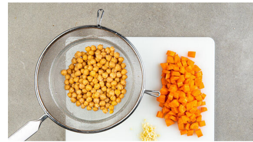
2. Zutaten vorbereiten

Die Baconstreifen in einem großen Topf bei mittlerer Hitze in 5-7Min. goldbraun und knusprig braten. Den Bacon aus dem Topf nehmen und beiseitestellen, dabei möglichst viel Bratenfett im Topf lassen.