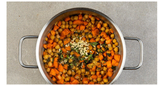
3. Sauce ansetzen

800ml Wasser in einem Wasserkocher aufkochen. Den Knoblauch schälen und fein würfeln. Die Karotten ggf. schälen, längs vierteln und in ca. 0,5cm große Würfel schneiden. Die Kichererbsen in einem Sieb mit kaltem Wasser abspülen und abtropfen lassen.