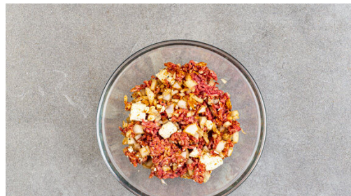
4. Nüsse & Hack vorbereiten

Den Backofen auf 240°C (220°C Umluft) vorheizen. In einem kleinen Topf 300ml leicht gesalzenes Wasser zum Kochen bringen. Die Zucchini in ca. 1cm dünne Scheiben schneiden. Die Paprika halbieren und entkernen, dann eine Hälfte in ca. 2cm große Würfel, die andere Hälfte in dünne Streifen schneiden. Die Zwiebel schälen, halbieren und fein würfeln.