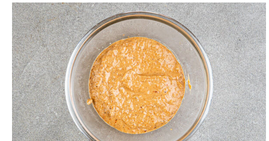
6. Muhammara zubereiten

Die Paprikawürfel auf einer Seite eines mit Backpapier ausgelegten Backblechs mit 1TL Olivenöl vermengen. Die Zucchini auf der anderen Seite mit 2TL Olivenöl vermengen und das Gemüse mit 1 kräftigen Prise Salz würzen. Den Knoblauch samt Schale auf das Blech legen und alles im mittleren Teil des Ofens 20-24Min. backen, bis das Gemüse Röstspuren aufweist und sehr weich ist.