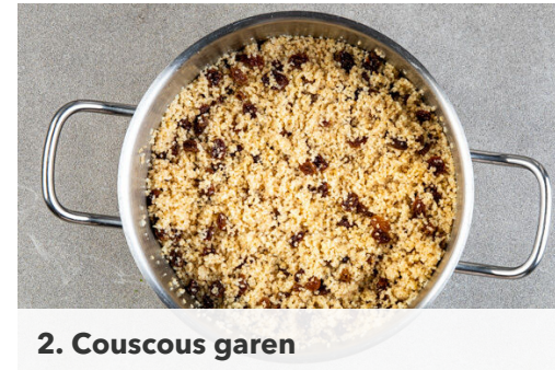
2. Couscous garen

Die Walnüsse grob hacken, dann in einer mittelgroßen Pfanne ohne Zugabe von Fett bei mittlerer Hitze 1-2Min. anrösten. Vorsicht , sie können schnell zu dunkel werden. Zum Abkühlen aus der Pfanne nehmen und beiseitestellen. Den Feta grob zerkrümeln und mit dem Hackfleisch , den Zwiebeln , der Gewürzmischung sowie je 1 kräftigen Prise Salz und Pfeffer vermengen.