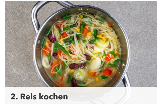
2. Reis kochen

In einem Wasserkocher 750ml Wasser zum Kochen bringen. Die Schalotten schälen und grob würfeln. Den Ingwer schälen und grob reiben. Die Tomaten in ca. 1cm große Würfel schneiden. Den Reis in einem Sieb kalt abspülen, bis das Wasser klar bleibt.