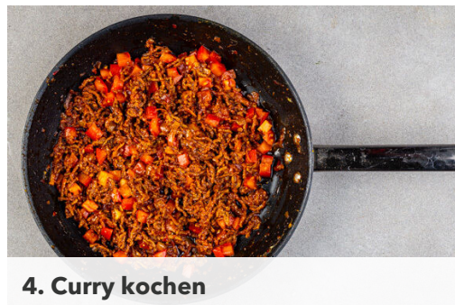
4. Curry kochen

Inzwischen die Schalotten , den Ingwer , die Knoblauchflocken , 3/4 der Gewürzmischung oder mehr nach Geschmack sowie das Currypulver in einer großen Pfanne mit 2EL Pflanzenöl, 1TL Salz und 1 kräftigen Prise Pfeffer bei starker Hitze ca. 2Min. anbraten.