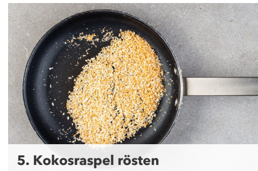
5. Kokosraspel rösten

Das Hackfleisch , die Tomaten und das Tomatenmark in die Pfanne geben und ca. 4Min. braten, bis das Hackfleisch goldbraun ist. Das Curry mit den restlichen 150ml Wasser aus dem Wasserkocher ablöschen, zum Kochen bringen und bei niedriger Hitze 3-4Min. einköcheln lassen, bis die meiste Flüssigkeit verdampft ist.