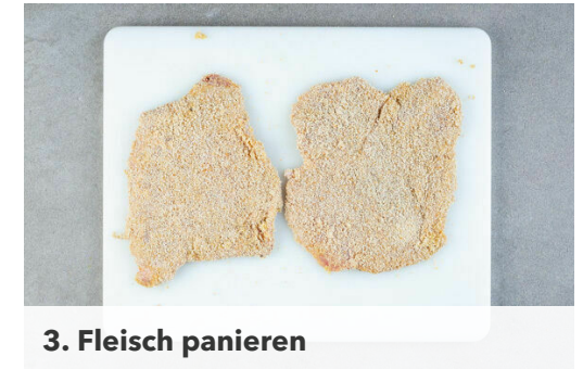
3. Fleisch panieren

Die Maiskörner mit einem scharfen Messer vom Kolben schneiden. 2/3 des Maises zu den Kartoffeln geben, 2EL Butter sowie nach Wunsch einen kleinen Schuss Milch hinzufügen und zu einem groben Püree stampfen. Mit Salz und Pfeffer abschmecken und den restlichen Mais unterheben.