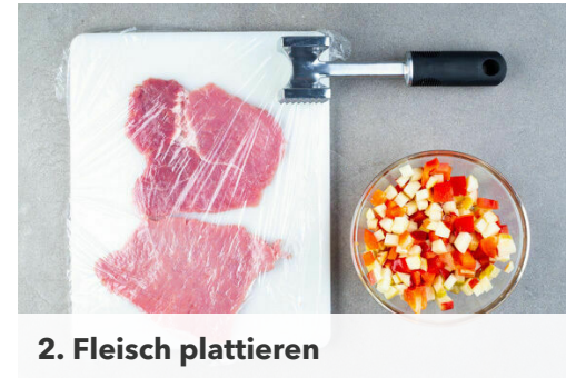
2. Fleisch plattieren

Eine große Pfanne mit einer ca. 0,5cm hohen Schicht Pflanzenöl bei mittlerer bis starker Hitze erwärmen. Jeweils 2 Schnitzel nacheinander in das heiße Öl geben und auf jeder Seite ca. 4Min. goldbraun braten. Tipp: Wenn es schnell gehen soll, zwei Pfannen verwenden. Die Schnitzel auf etwas Küchentrepp abtropfen lassen und die Pfanne auswischen.