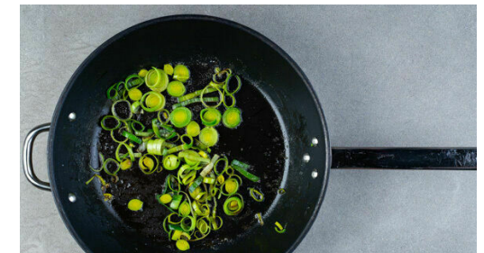
6. Lauch braten

Auf einem tiefen Teller 100g Mehl mit 1 Prise Pfeffer verrühren. Auf einem zweiten Teller 1 Ei mit der Gewürzmischung verquirlen. Auf einem dritten Teller die Semmelbrösel bereitstellen. Das Fleisch nacheinander im Mehl, dem verquirlten Ei und den Semmelbröseln wenden.