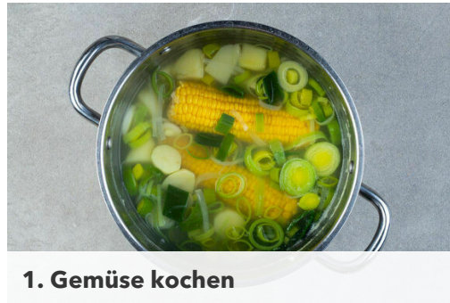
1. Gemüse kochen

Energie 969kcal, Fett 42.5g, Kohlenhydrate 103.8g, Eiweiß 43.3g