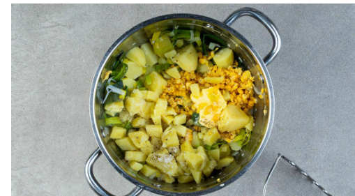
5. Gemüse stampfen

Die Paprika und die Äpfel jeweils vierteln, entkernen und in ca. 0,5cm kleine Würfel schneiden. Die Zitrone halbieren und auspressen. Die Paprika- und die Apfelwürfel mit 2-3EL Zitronensaft , 2TL Zucker und 1/2TL Salz vermengen und beiseitestellen. Das Fleisch trocken tupfen und zwischen Frischhaltefolie ca. 0,5cm dünn plattieren.