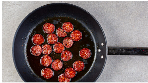
1. Chorizo braten

Energie 581kcal, Fett 39.8g, Kohlenhydrate 33.0g, Eiweiß 21.5g