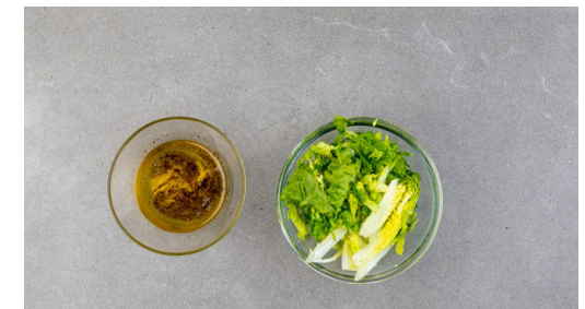
6. Salat zubereiten

Die Zwiebel schälen, halbieren und in feine Würfel schneiden. Den Knoblauch schälen und ebenfalls fein würfeln. Die Aprikosen halbieren, den Stein entfernen und die Aprikosen in möglichst kleine Würfel schneiden.