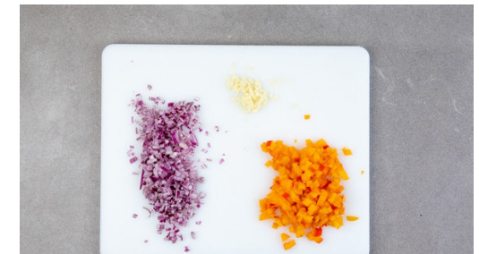
3. Relish vorbereiten

Das Fleisch trocken tupfen und in einer mittelgroßen Pfanne mit 1EL Olivenöl bei starker Hitze auf jeder Seite 1-2Min. scharf anbraten. Mit Salz und Pfeffer würzen, in eine Auflaufform geben und im Ofen 4-6Min. oder bis zum gewünschten Garpunkt nachgaren. Aus dem Ofen nehmen und 2-3Min. ruhen lassen. Tipp: Der Fleischsaft kann unter das Relish gemischt werden.