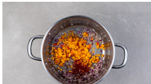
4. Relish zubereiten

Den Backofen auf 240°C Umluft (260°C Ober-/Unterhitze) vorheizen. Sehr große Kartoffeln halbieren. In einem mittelgroßen Topf ausreichend gesalzenes Wasser zum Kochen bringen, die Kartoffeln hineingeben und ca. 10Min. vorkochen. In ein Sieb abgießen und abtropfen lassen. Den Topf aufbewahren.