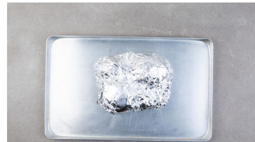
2. Kartoffeln backen

Die Zwiebeln und den Knoblauch in dem Topf mit 1-2EL Olivenöl bei mittlerer Hitze ca. 2Min. farblos anschwitzen. Die Aprikosen , die Sweet-Chili-Sauce , 2-3EL Wasser sowie 1TL Zucker unterrühren und 1-2Min. karamellisieren lassen. Nach Geschmack mit 1/2EL Essig ablöschen und mit Salz und Pfeffer würzen. Ggf. etwas einkochen lassen.