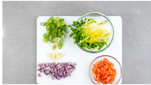
1. Gemüse vorbereiten

Energie 849kcal, Fett 38.3g, Kohlenhydrate 77.6g, Eiweiß 44.9g