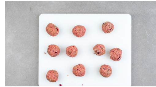
2. Hackbällchen formen

Die Hackbällchen in eine Auflaufform geben, mit der Tomatensauce übergießen und mit dem Käse bestreuen. Die Tomatenwürfel um die Hackbällchen verteilen, dann im Ofen 12-15Min. backen, bis die Hackbällchen gar sind.