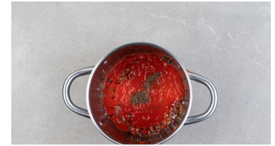
3. Tomatensauce köcheln

Die Baguettebrötchen auf einem Backrost ca. 4Min. knusprig und goldbraun aufbacken. Etwas auskühlen lassen und aufschneiden.