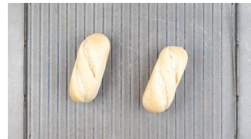
5. Brötchen aufbacken

Das Hackfleisch mit der 1/2 der Zwiebeln und 2EL Senf verkneten, kräftig mit Salz und Pfeffer würzen und noch einmal gut durchkneten. Mit einem Esslöffel Portionen abstechen und mit den Händen insgesamt ca. 20 gleich große Hackbällchen formen.