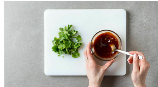
5. Sauce anrühren

Den Brokkoli und die Pilze in der Pfanne mit 1EL Pflanzenöl bei mittlerer bis starker Hitze 4-5Min. anbraten. Die Hitze reduzieren, die Zwiebeln zugeben und bei mittlerer bis niedriger Hitze 2-3Min. mitbraten.