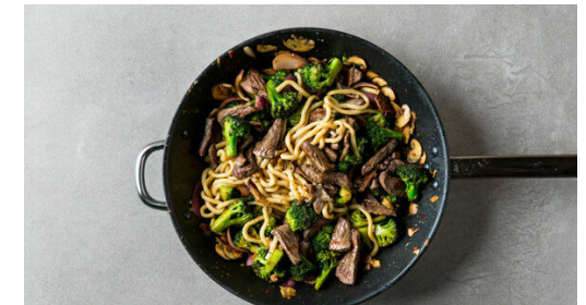
6. Nudeln zugeben

Die Sojasauce mit 3EL Wasser, 2EL Honig und 2/3 der Chilipaste verrühren. Tipp: Wer es gerne scharf mag, verwendet mehr Chilipaste . Den Koriander samt Stängeln grob schneiden.