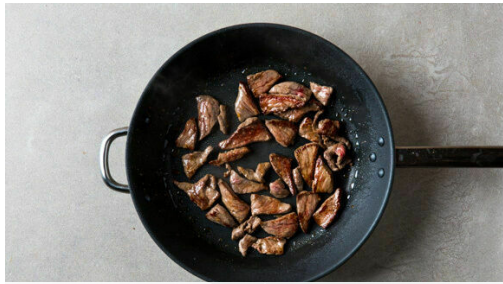
1. Fleisch braten

Energie 504kcal, Fett 12.1g, Kohlenhydrate 67.0g, Eiweiß 35.4g