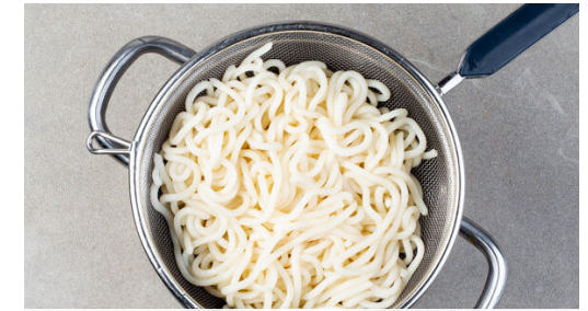
3. Nudeln kochen

Den Brokkoli in mundgerechte Röschen schneiden. Die Pilze ggf. mit etwas Küchenkrepp oder einer Bürste säubern und in dünne Scheiben schneiden. Die Zwiebel schälen, halbieren und in dünne Streifen schneiden.