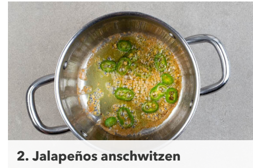
2. Jalapeños anschwitzen

Den Mais mit einem scharfen Messer vom Kolben schneiden. In einer großen Pfanne 2EL Butter bei mittlerer Hitze schmelzen. Den Mais und den Brokkoli zugeben und 3-5Min. braten, bis das Gemüse leicht gebräunt ist. Das Gemüse aus der Pfanne nehmen und mit der Vinaigrette vermengen.