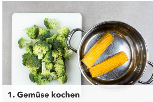
1. Gemüse kochen

Energie 608kcal, Fett 45.8g, Kohlenhydrate 21.3g, Eiweiß 27.6g