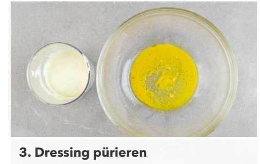
3. Dressing pürieren

Das Fleisch mit dem Paprikapulver bestreuen und in derselben Pfanne mit 2EL Butter bei mittlerer Hitze 2-3Min. auf jeder Seite braten.