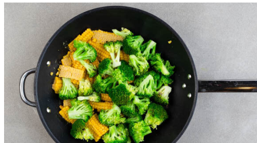
4. Gemüse braten

In einem großen Topf ausreichend gesalzenes Wasser für den Mais und den Brokkoli aufkochen. Die Maiskolben schälen, ggf. vorhandene Härchen entfernen. Den Brokkoli in mundgerechte Röschen schneiden. Den Mais bei mittlerer Hitze ca. 12Min. kochen, bis er gar und saftig ist. In den letzten ca. 2Min. den Brokkoli zugeben und mitkochen. Das Gemüse in ein Sieb abgießen.