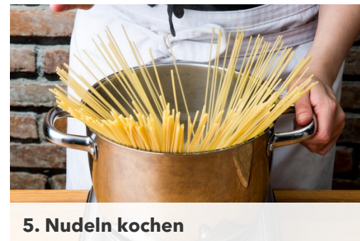
5. Nudeln kochen

Nun 800ml Wasser im Wasserkocher aufkochen. Die Erbsen aus der Schale pulen und für ca. 2-3Min. in dem kochenden Wasser garen/blanchieren, dann abgießen und mit kaltem Wasser abschrecken.