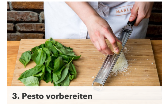
3. Pesto vorbereiten

Sobald das Salzwasser kocht, die Pasta für ca. 7-8Min. kochen, bis die Nudeln gar sind. Ca. 100ml Pastawasser abschöpfen, den Rest abgießen und die Nudeln kalt abschrecken.