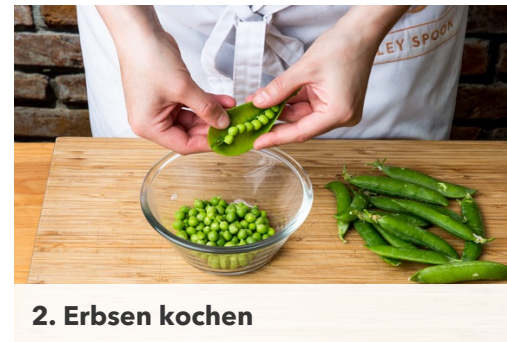
2. Erbsen kochen

Die Basilikumblätter mit den gerösteten Cashews , geriebenen Käse und ca. 3-4EL Olivenöl mithilfe eines Stabmixer fein pürieren und mit Salz und Pfeffer abschmecken.