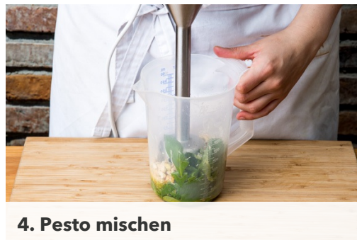
4. Pesto mischen

In einem mittelgroßen Topf ausreichend gesalzenes Wasser für die Pasta aufsetzen. Inzwischen in einer kleinen Pfanne die Cashewnüsse trocken bei mittlerer Hitze ca. 2-3Min. rösten. Vorsicht, sie können schnell verbrennen. Die Pfanne aufheben.