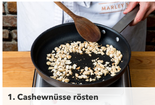
1. Cashewnüsse rösten

Energie 890kcal, Fett 36.7g, Kohlenhydrate 96.0g, Eiweiß 39.2g