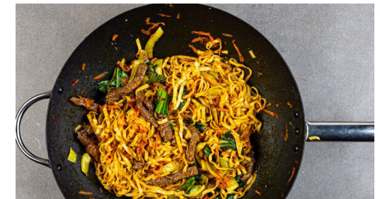
6. Wok fertigstellen

Das Fleisch trocken tupfen und in einer großen Pfanne oder einem Wok mit 2TL Pflanzenöl bei starker Hitze 1-2Min. scharf anbraten. Herausnehmen und auf einem Teller beiseitestellen.