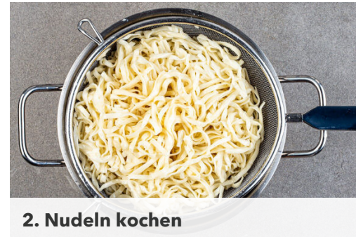
2. Nudeln kochen

Den Knoblauch und die 1/2 des Currypulvers in derselben Pfanne oder dem Wok mit 2TL Pflanzenöl ca. 30Sek. bei mittlerer Hitze anbraten. Die Karotten , die weißen Pak-Choi-Streifen und die Limettenschale zugeben und ca. 1Min. mitbraten. Mit dem Sambal Oelek und der Hoisinsauce ablöschen. Tipp: Wer es nicht so scharf mag, verwendet weniger Sambal Oelek .