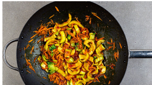
4. Gemüse braten

Den Knoblauch schälen und fein reiben oder durch eine Knoblauchpresse drücken. Die Karotte ggf. schälen und grob raspeln. Den Strunk des Pak Choi entfernen, dann den weißen Teil in ca. 1cm breite, die grünen Blätter in ca. 2cm breite Streifen schneiden. Die Limettenschale abreiben, 1/2 Limette auspressen, die andere Hälfte in Spalten schneiden.