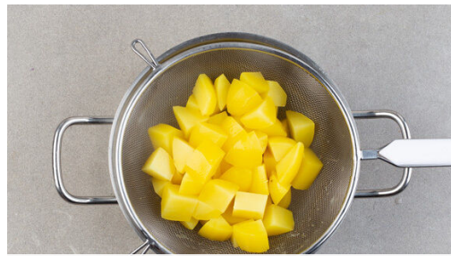
1. Kartoffeln garen

Energie 741kcal, Fett 40.2g, Kohlenhydrate 64.3g, Eiweiß 31.5g