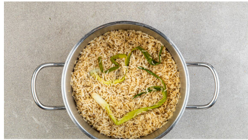
1. Reis kochen

Energie 643kcal, Fett 24.9g, Kohlenhydrate 70.2g, Eiweiß 35.9g