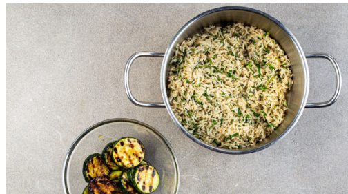
4. Zucchini und Reis würzen

In einem mittelgroßen Topf 600ml leicht gesalzenes Wasser zum Kochen bringen. Das untere Ende und ggf. die oberen 1-2cm der Lauchzwiebeln entfernen. Die Lauchzwiebeln halbieren und mit dem Reis in das kochende Wasser geben. Abgedeckt bei niedrigster Hitze 8-10Min. kochen, bis das Wasser aufgesogen und der Reis gar ist. Noch ca. 5Min. ohne Hitzezufuhr ziehen lassen.