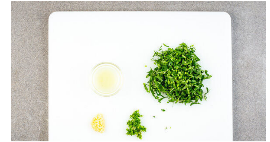
3. Zutaten vorbereiten

Das Fleisch trocken tupfen, rundum mit 2TL Olivenöl einreiben und bei starker Hitze auf der Fettseite 2-4Min. scharf anbraten. Wenden und weitere 2-4Min. braten, je nach Dicke des Fleisches . Die Hitze reduzieren und das Fleisch 1-3Min. abgedeckt garen, je nachdem, ob es medium oder durch sein soll. Dann mit 1 Prise Salz würzen und auf einem Teller abgedeckt ruhen lassen.