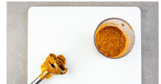
6. Salsa pürieren

Die Limettenschalen abreiben, dann die Limetten halbieren und auspressen. Den Koriander samt Stängeln fein schneiden. Den Knoblauch schälen und sehr fein würfeln oder durch eine Knoblauchpresse drücken.