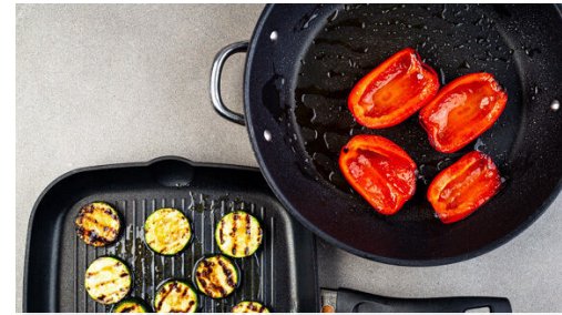
2. Gemüse garen

Die gegrillte Zucchini zurück in die Schüssel geben, mit der Limettenschale , dem Knoblauch sowie 2 kräftigen Prisen Salz vermengen und mit einem Teller abgedeckt ziehen lassen. Die Lauchzwiebeln entfernen, dann den Koriander , 2EL Limettensaft und 1 kräftige Prise Salz unter den Reis rühren. Die Lauchzwiebeln aufbewahren.