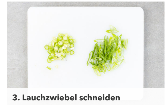
3. Lauchzwiebel schneiden

Das Fleisch trocken tupfen, in ca. 1cm dünne Streifen schneiden und in der Pfanne mit 1EL Pflanzenöl bei starker Hitze ca. 1Min. rundum scharf anbraten. Die weißen Lauchzwiebelringe dazugeben und kurz mitbraten, dann die Sojasauce und 1EL Honig unterrühren, kräftig mit Pfeffer würzen und 1-2Min. weiter braten.