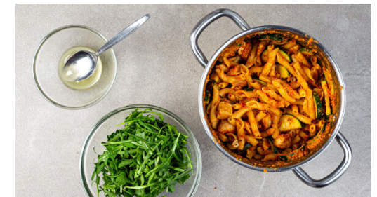
6. Fertigstellen & servieren

Den Käse fein reiben. Die Sonnenblumenkerne , den Käse , die getrockneten Tomaten , die Paprika , den Knoblauch , 1TL Essig und 1 kräftige Prise Salz in einem hohen Gefäß mit einem Stabmixer zu einem glatten Pesto pürieren.