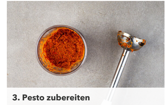
3. Pesto zubereiten

Die Pasta in das kochende Wasser geben und in 6-8Min. bissfest kochen. 100ml Kochwasser abschöpfen, dann die Pasta in ein Sieb abgießen und abtropfen lassen. Die Pasta und 100ml Kochwasser zurück in den Topf geben, das fertig gebratene Fleisch und die Zucchini hinzufügen.