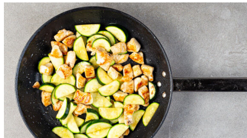
4. Fleisch & Zucchini braten

In einem mittelgroßen Topf ausreichend gesalzenes Wasser für die Pasta zum Kochen bringen. Die Paprika vierteln, entkernen und in 2-3cm große Stücke schneiden. Die Zucchini längs halbieren und in ca. 0,5cm dünne Scheiben schneiden. Den Knoblauch schälen und halbieren. Die getrockneten Tomaten grob schneiden.