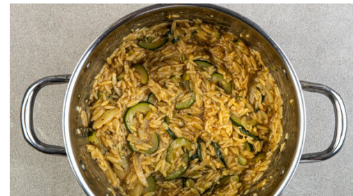
5. Pasta verfeinern

Die Zucchini und den Fenchel in einem großen Topf mit 2EL Olivenöl und der Gewürzmischung bei mittlerer Hitze 4-6Min. anbraten, dann den Knoblauch und die Oliven zugeben und ca. 30Sek. mitbraten. Das Brühgewürz und das kochende Wasser einrühren.