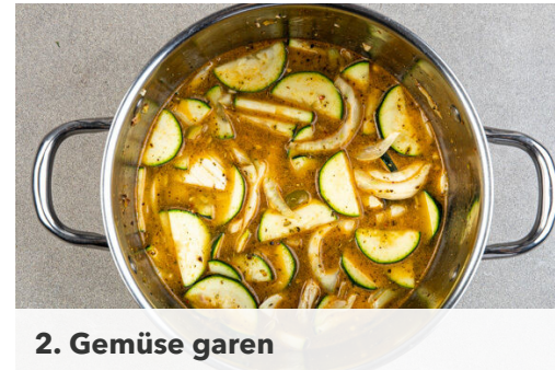
2. Gemüse garen

Inzwischen das Fleisch trocken tupfen und in einer großen Pfanne mit 2EL Olivenöl bei starker Hitze auf jeder Seite 2-3Min. braten, abhängig davon, ob es medium oder eher durchgebraten sein soll. Mit je 1 kräftigen Prise Salz und Pfeffer würzen, aus der Pfanne nehmen und bis zum Servieren auf einem Teller abgedeckt ruhen lassen.