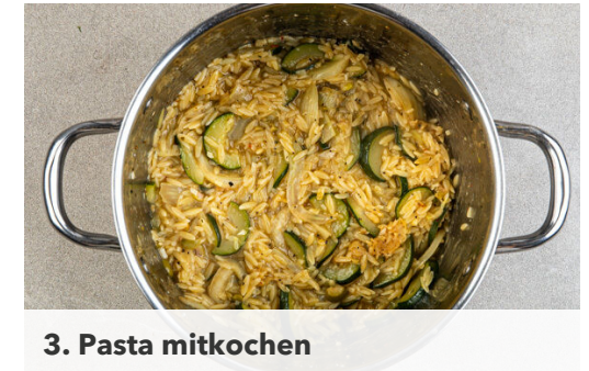
3. Pasta mitkochen

Die Pasta mit 2EL Butter und nach Geschmack mit Salz und Pfeffer sowie 2EL Balsamicoessig verfeinern.