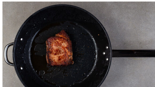
4. Fleisch braten

In einem Wasserkocher 1,2L Wasser zum Kochen bringen. Die Zucchini längs halbieren und in ca. 0,5cm dicke Scheiben schneiden. Den Fenchel längs halbieren und in dünne Streifen schneiden, dabei den Strunk entfernen. Das Fenchelgrün für die Garnitur beiseitelegen. Den Knoblauch schälen und grob würfeln. Die Oliven grob würfeln.