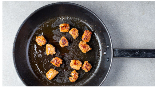
1. Salsiccia braten

Energie 744kcal, Fett 57.3g, Kohlenhydrate 23.9g, Eiweiß 31.0g