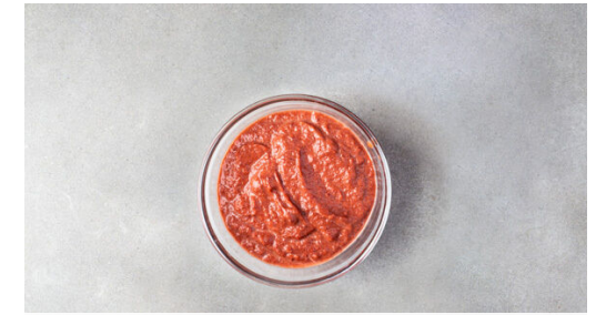
3. Rote Bete pürieren

Die Schalotte schälen, halbieren und fein würfeln. Die getrockneten Tomaten grob schneiden und mit den Schalotten , der Balsamicocreme , 1EL Olivenöl und 1EL Essig verrühren. Das Dressing mit Salz und Pfeffer abschmecken.