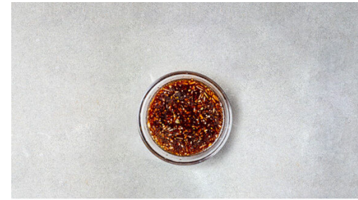
2. Dressing zubereiten

Die Salsiccia von der Wursthülle befreien, in mundgerechte Stücke schneiden und in einer mittelgroßen Pfanne mit 1EL Olivenöl bei mittlerer bis starker Hitze in 7-10Min. goldbraun und knusprig braten, dabei gelegentlich umrühren.