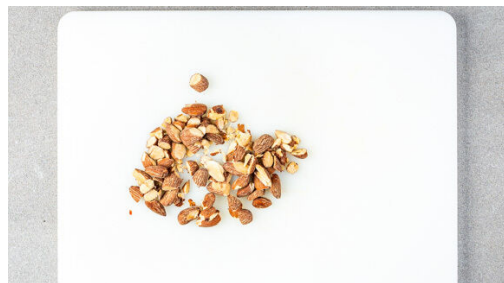
4. Rauchmandeln hacken

Die 1/2 der Roten Bete in ein Sieb abgießen, dabei die Flüssigkeit auffangen. Die Bete grob würfeln und mit der Flüssigkeit , 1TL Olivenöl und 1TL Essig in einem hohen Gefäß glatt pürieren, ggf. 1-2EL Wasser zufügen. Das Püree mit Salz und Pfeffer abschmecken. Tipp: Die übrige Rote Bete in einem Salat verwenden.